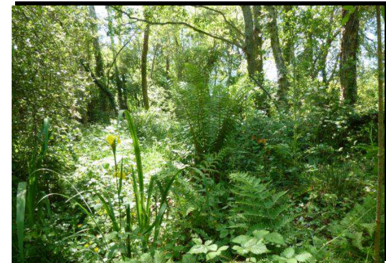
Boisement humide à tourbeux