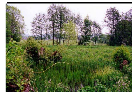
Prairie humide Roger Brun, Orne