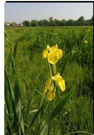
Iris faux-Açores, BV de la Mue