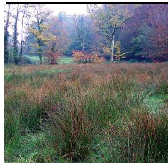
Fond de vallon humide près de Vire (Calvados)