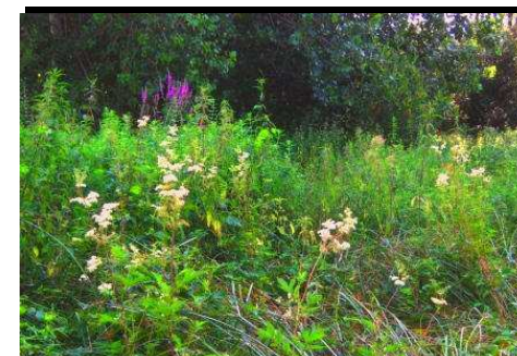
Prairie à "hautes herbes" ou Mégaphorbiaie