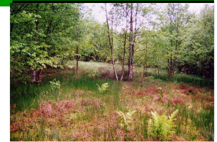
Tourbière de Commeauches