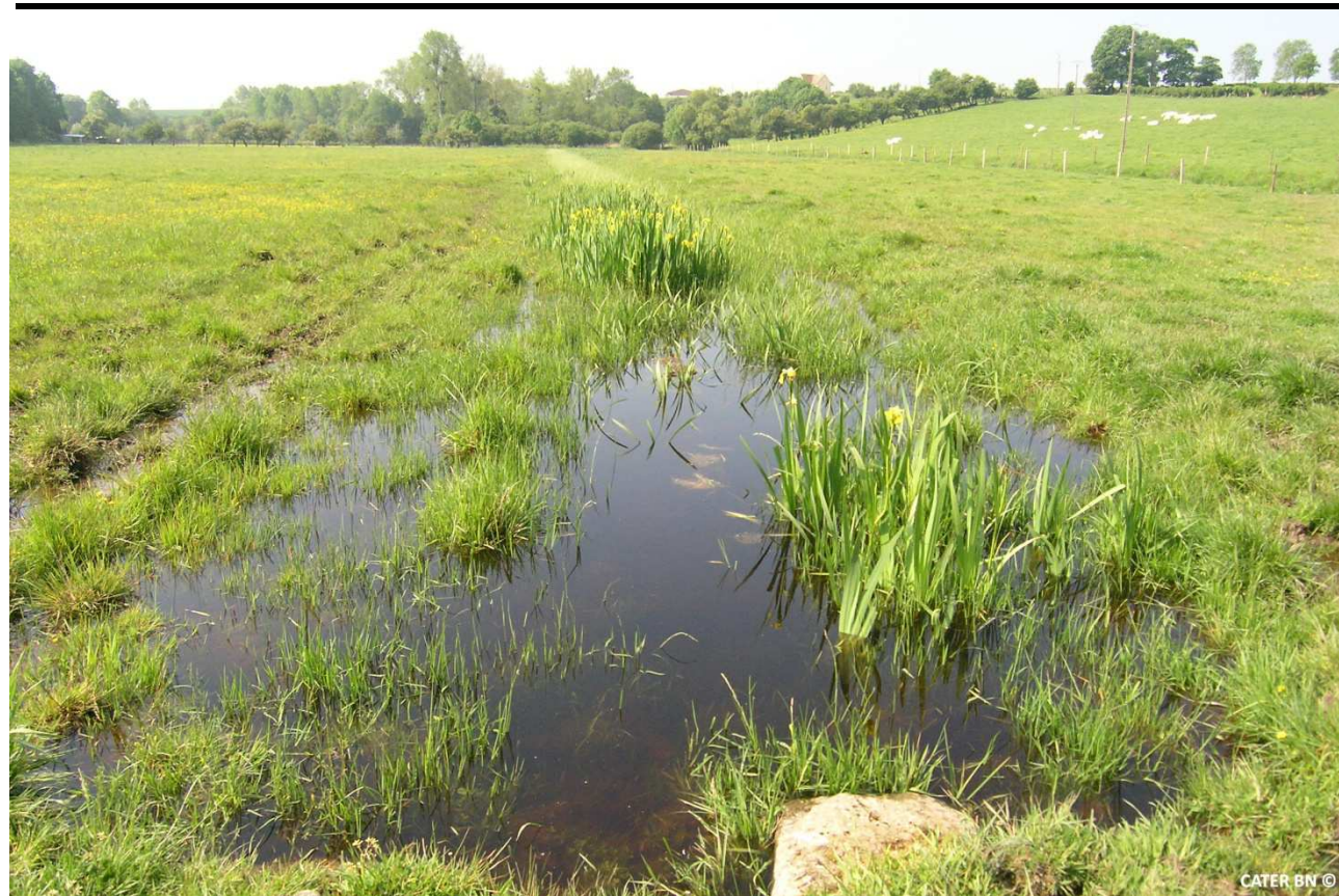
Bassin versant de la Mue